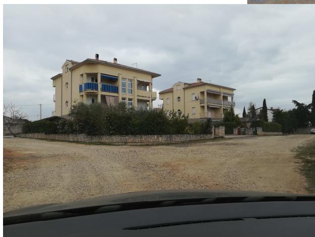
SLIKE 2 - 5 – postojeće stanje područja obuhvata UPU dijela stambenog naselja Veli – Mali Maj I