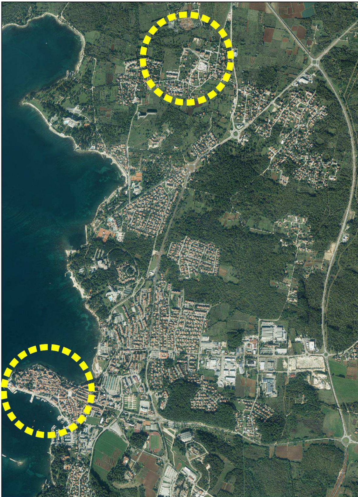
SLIKA 1 – položaj područja obuhvata UPU dijela stambenog naselja Veli – Mali Maj I u odnosu na širi prostor Grada Poreča