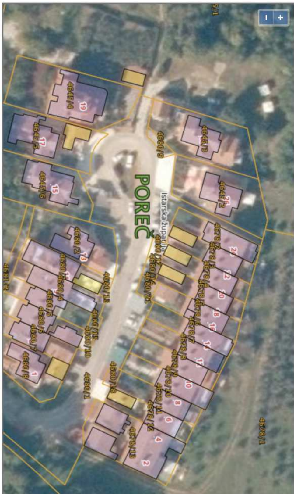
Izvod iz katastarskog plana za k.č. 4680/9 k.o. Poreč – neslužbena kopija