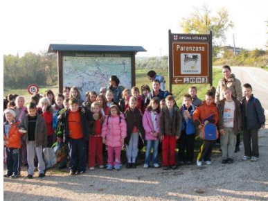
Poreč, 30 lipnja 2014.