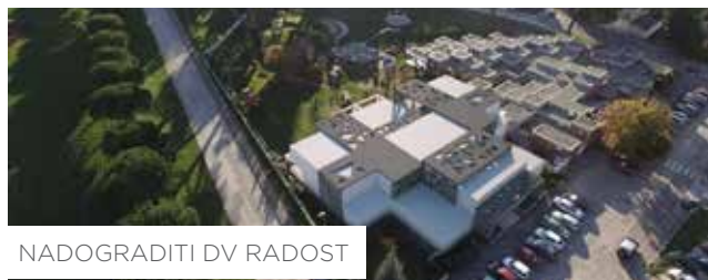
NADOGRADITI DV RADOST