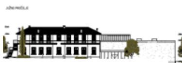
REKONSTRUKCIJU OSNOVNE ŠKOLE ŽBANDAJ