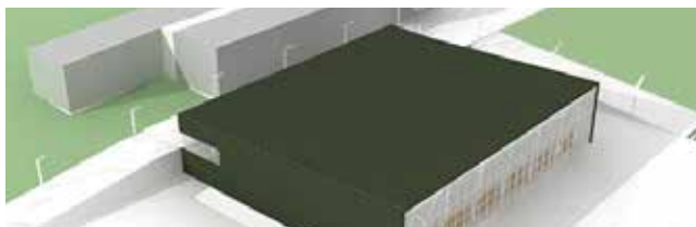
POČETI IZGRADNJU OSNOVNE ŠKOLE FINIDA